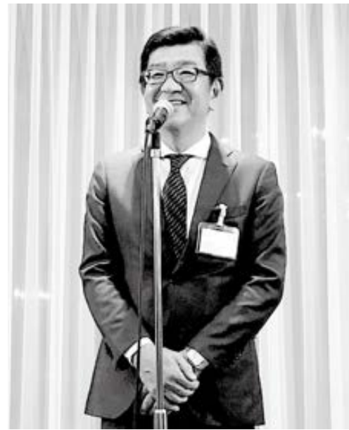
本田双日建材本部長の中締め