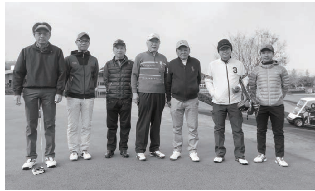
グランデージゴルフ倶楽部で行われたゴルフコンペ参加者

奈良県合板建材材商組合懇親ゴルフコンペは十二月十九日に七名が参加してグランデージゴルフ倶楽部で開催され