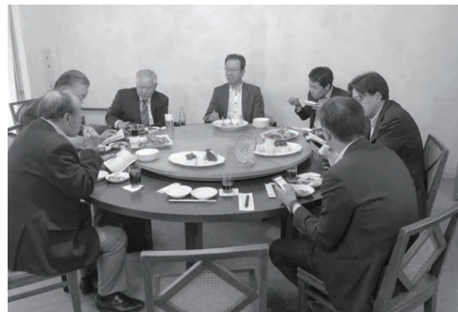
ゴルフコンペ後の懇親会