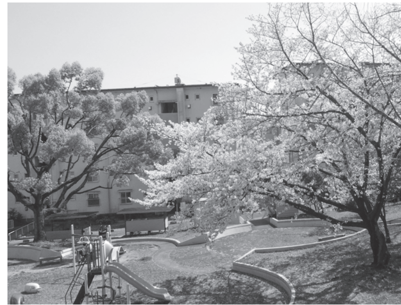
コロナウイルスで公園には人の姿も見られない

新型コロナウイルスに対し、何の対策もしないと日本で重症患者八十五万人、死亡者約四十一万人という驚愕の数字が政府の厚労省クラスター対策班から発表された。収束の目途も立たない中、人々は不安な生活を余儀なくされ、自粛ムードでストレスも限度に近づいている。住宅業界にも影響が出てきている。現場は動いていて、物流にも問題がなかったものの、清水建設の都内現場でコ