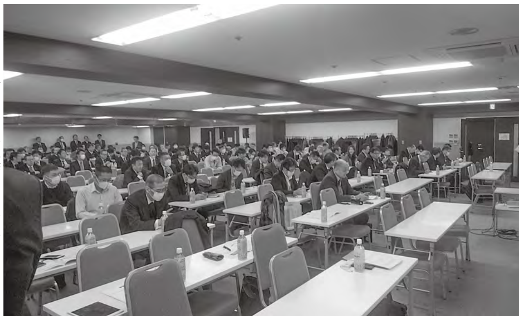
令和2年の住宅政策を聞く参加者

（三十一条、国際協力の推進（三十二条）を行う。事業者の責務は木材などを利用するに当たっては、合法伐採木材などを利用するよう