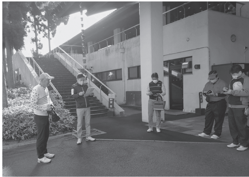
蒲生ゴルフ倶楽部での京合商ゴルフコンペ

京都合板商業組合の懇親ゴルフコンペは十一月十八日、滋賀県の蒲生ゴルフ倶楽部で総勢十一名が参加して開催さ