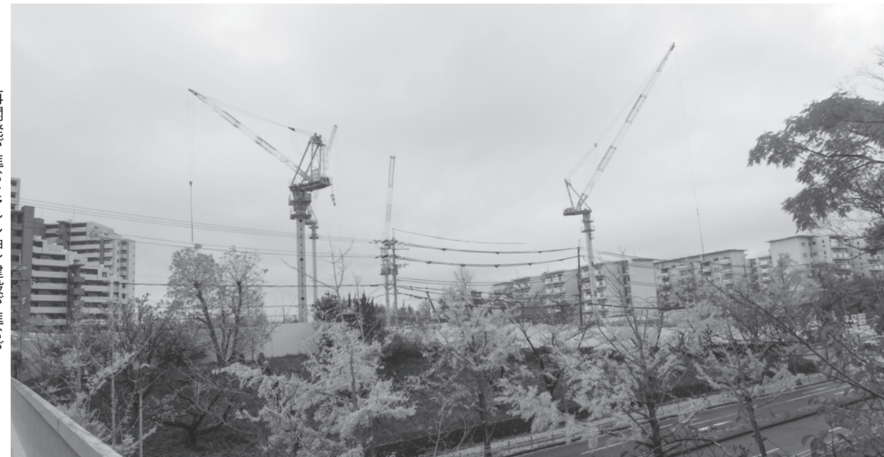
再開発が進むマンション建設が進むが...