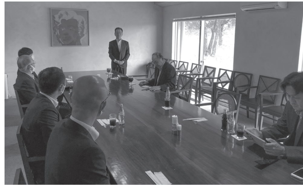
ゴルフコンペ終了後は和やかに親睦会を開く

大阪支店 〒550-0015 大阪市西区南堀江1-1-14(四ツ橋中塾ビル6F) TEL(06)6541-7735